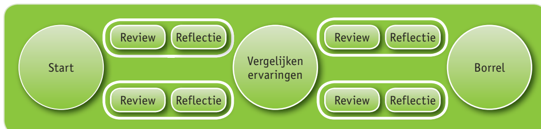
Figuur 4: reviewen als event

Deze variant is uitdagend, gaat diep en helpt lectoraten in zowel werkvorm als in zichtbaarheid/openbaarheid.