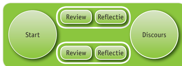
Figuur 3: parallel procesontwerp

De tweede variant is parallel (figuur 3). De groep splitst zich op in tweeën en behandelt naast elkaar twee onderzoeken. Men start gezamenlijk om de criteria te bespreken of de discussie erover op te frissen. Men eindigt gezamenlijk om het methodologisch discours voort te zetten. Alles bij elkaar vergt dit drie uur. Deze variant is in het bijzonder geschikt voor een kenniscentrum dat het eigen methodologisch discours wil ontwikkelen.