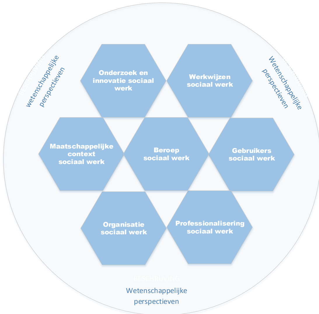
Figuur 1 bouwstenen en perspectieven van de kennisbasis sociaal werkopleidingen